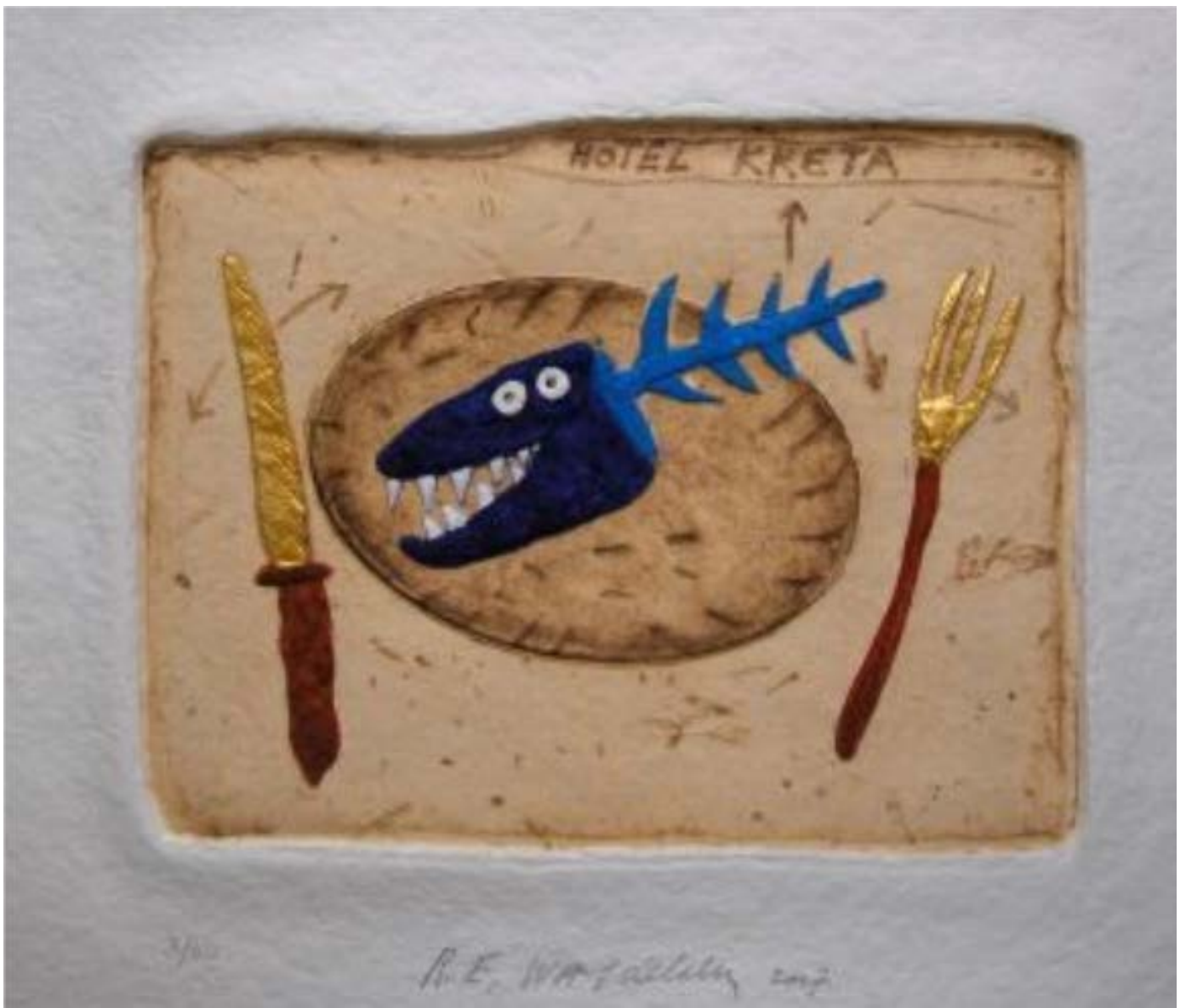
Assiette de poisson