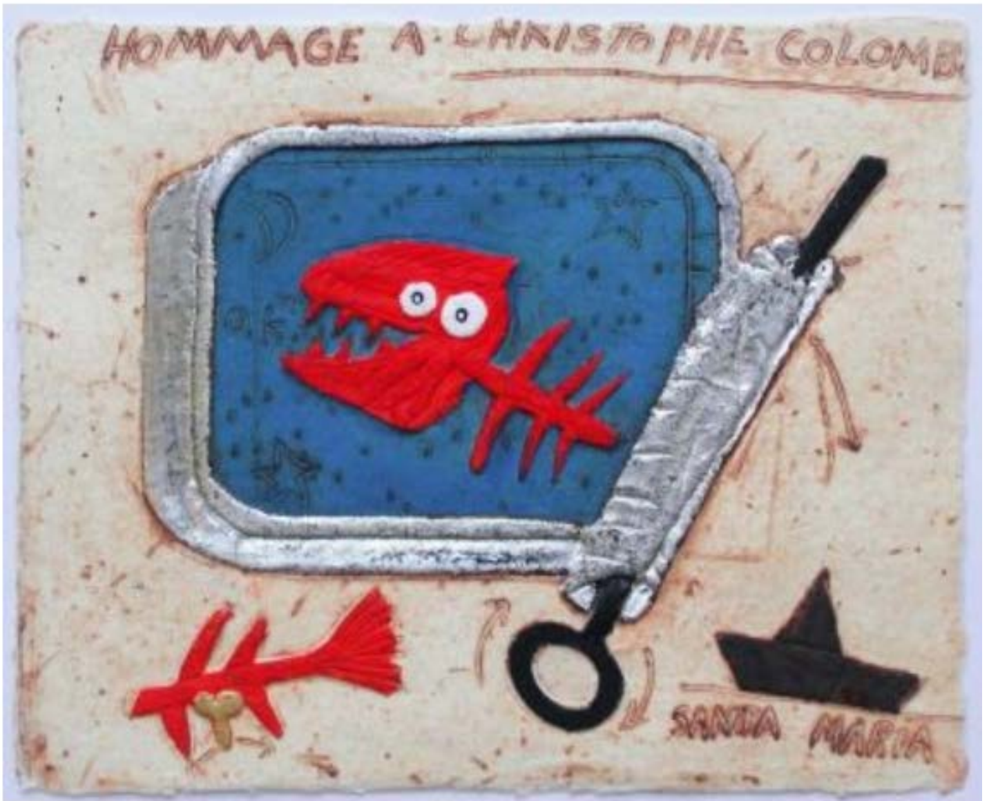
Santa Maria, hommage à Christophe Colomb