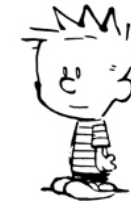
Table de 10

Pour multiplier par 100 , on ajoute deux 0 à droite du nombre. Un nombre est multiple de 100 si son chiffre des unités et des dizaines est 0 .