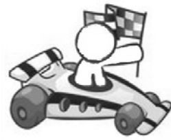
Chauffeur du dimanche