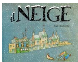
Il neige , Uri Shulevitz

- Lecture d'album autour du thème de l'hiver et de Noël blanc (dans le cadre de notre thème du moment): la bibliothécaire a lu 3 albums :